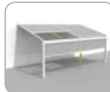
Lagune® + Frontfix windfeste, verschiebbare Vorderseite