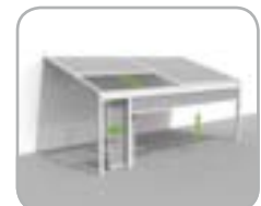
Lagune® + Frontfix + Loggiawood® oder Loggiascreen® 4FIX Schiebetür