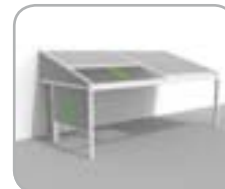
Lagune® + Triangle + Sidefix + Loggiawood® oder Loggiascreen® 4FIX Schiebetür