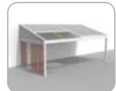
Lagune® + Triangle + Loggiawood® oder Loggiascreen® 4FIX Schiebe-systeme