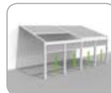
Lagune® + mehrere Frontfix