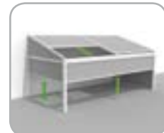
Lagune® + Frontfix + Sidefix windfeste, verschiebbare Vorderseite und Seiten