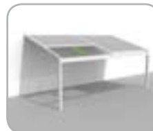
Lagune® = BASIS + Rooffix = Struktur + windfestes, wasserdichtes, lichtdurchlässiges Textilsonnenschutzdach

Konfigurationsbeispiele für eine Lagune® ≤ 6 m Anzahl der Tuchteile hängt von der Breite der Lagune® ab. Andere Konfigurationen auf Anfrage.