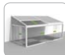
Lagune® + Ganzglas - Schiebe-Systeme vorne und/oder seitlich