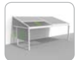
Lagune® + Triangle + mehrere Sidefix windfeste, verschließbare Seiten