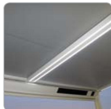
Lagune® Beam-Modul & Light-Modul

Lagune® Beam ist auch einzeln erhältlich.