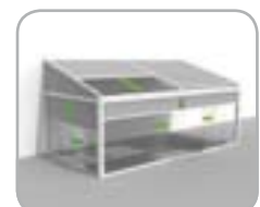
Lagune® + Ganzglas - Schiebe-Systeme in Kombination mit Frontfix, Sidefix