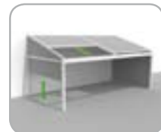
Lagune® + Sidefix windfeste, verschiebbare Seiten