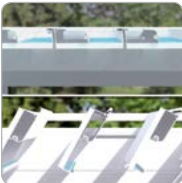
Kontrollierte Wasserabfuhr auch bei geöffneten Lamellen