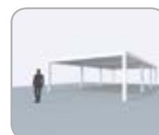
Mehrteilige Koppelung an Pivot- oder Spanseite