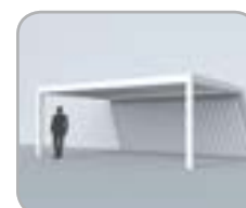
Fassadenmontage (2 Pfosten)