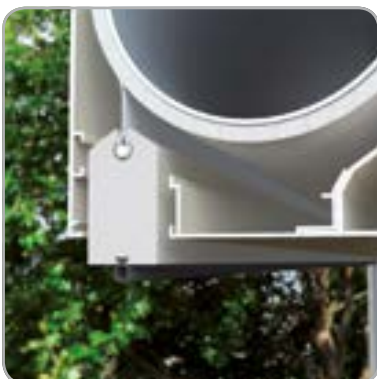
Integrierter Sonnenschutz: Endschiene ist in der Kassette verborgen