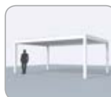
Freistehend (4 Pfosten)