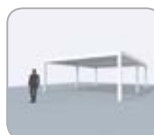
2-teilige Koppelung an Pivot- oder Spanseite möglich